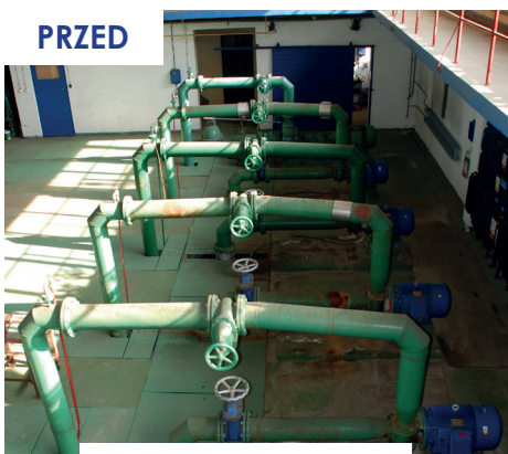
Zestaw pomp sieciowych