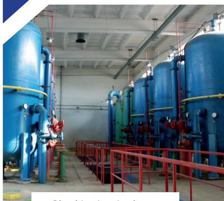
Ciągi technologiczne (uzdatnianie wody surowej)